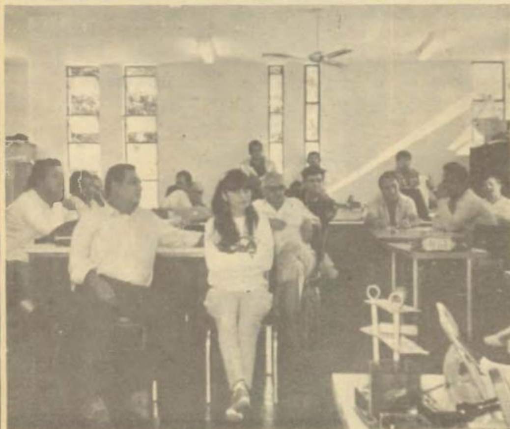
Flagrante da reunião em Cruzeiro do Oeste, quando vários assuntos foram debatidos.