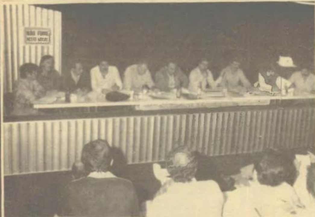
Em data de 09 de julho último, na cidade de Maringá, esteve presente uma equipe de técnicos da C. R. E.