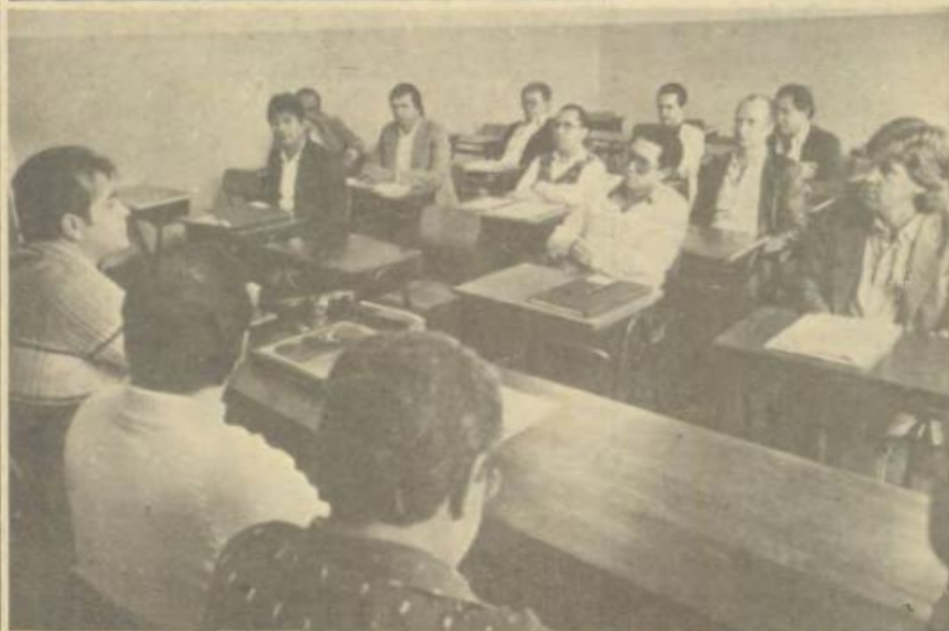
Flagrante da Reunião do Diretor e Inspectores da CRE, com os Delegados, quando definiram o "modus operandi" da Classe para intensificar a fiscalização, a fim de obter maior índice de arrecadação.

Cia União de Seguros Gerais Rua Gal. Carneiro, 904 Fone: 264-5888