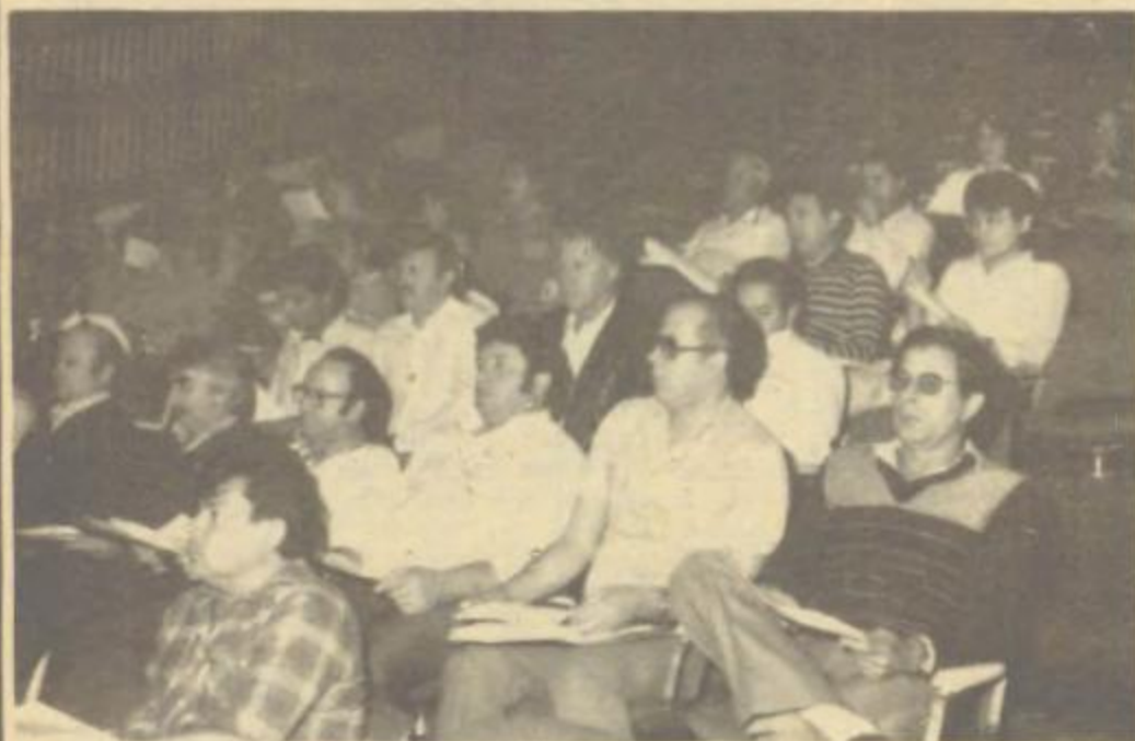
O motivo foi a reunião sobre a "Microempresa" — Lei N.º 8.084/85 e Instrução SEFI N.º 933/85.