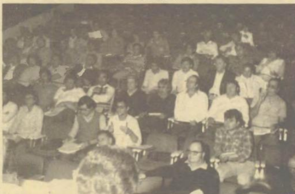
Inspectores Regionais de Tributação, Arrecadação e Fiscalização das Delegacias estiveram presentes.