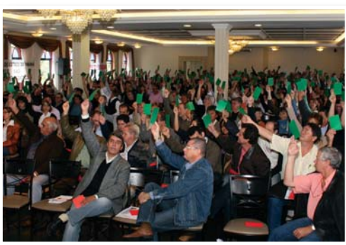
Dia 25 SINDAFEP realiza Assembleia Geral Extraordinária.

Dia 16 Reunião conjunta entre o Conselho de Representantes Sindicais e a Comissão Estadual, para definição da pauta da Assembleia Geral Extraordinária e das sugestões de encaminhamentos e ações a serem discutidas.