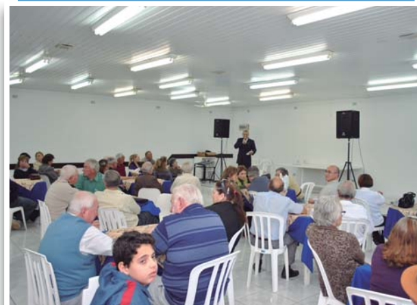
Encontro Mensal de Aposentados e Pensionistas