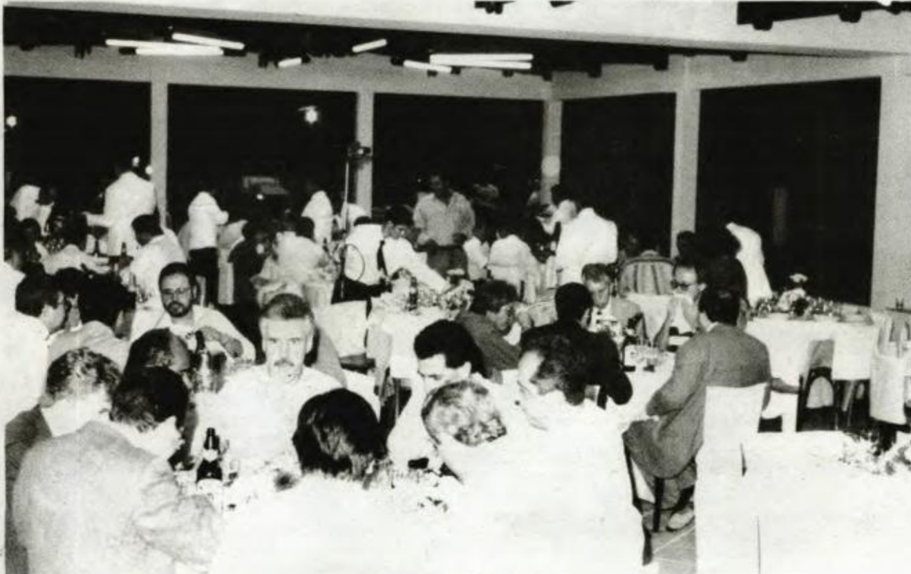
Flagrante da festa