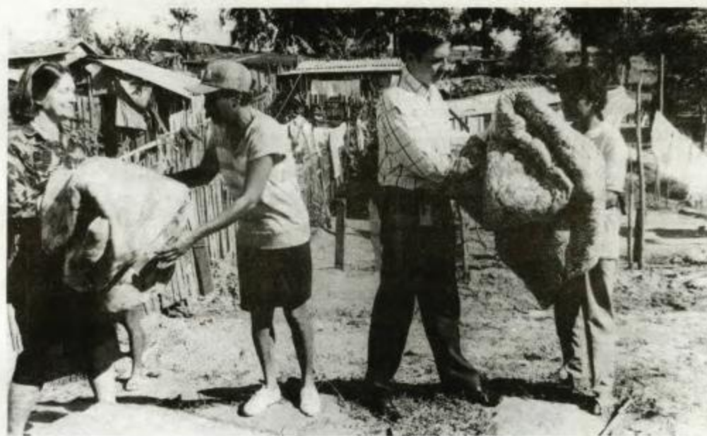
Campanha do Agasalho - Umuarama

Com a chegada do inverno, sentimos a necessidade de aquecer o próximo... Por isso, a 11ª DRR/ Umuarama lançou a Campanha do Cobertor, que contou com a colaboração dos funcionários na arrecadação dos mesmos, que foram entregues à população carente do município de Umuarama.