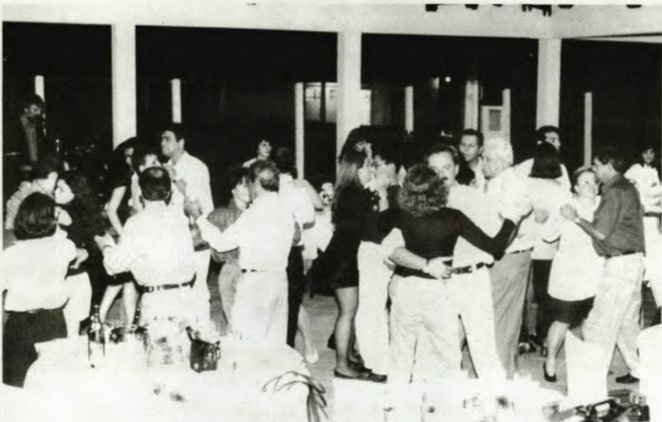
Flagrante do Baile