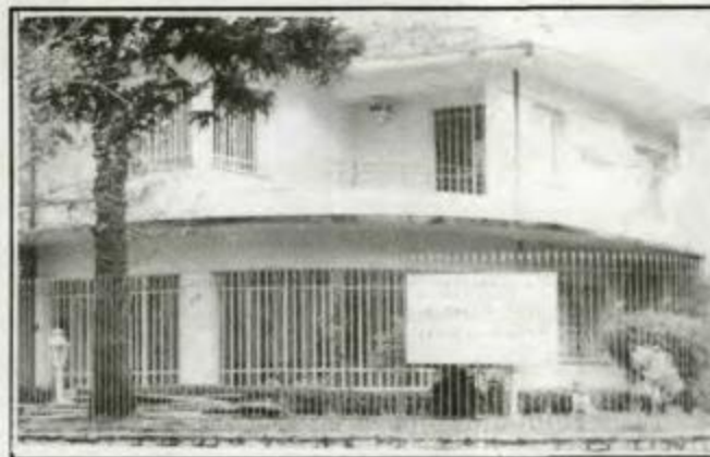
Nova sede do Sindicato Rua Comendador Macedo, 610

Ao invés de "derrubar" impostos os deputados federais, estaduais e vereadores deveriam é fiscalizar os gastos do governo, competência para a qual foram eleitos.