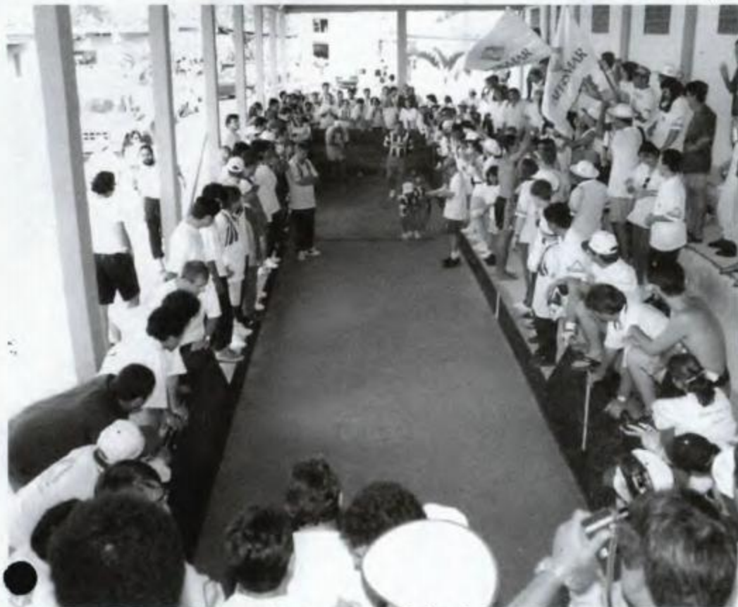
Nova cancha de bocha