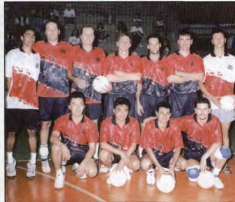
Vôlei - Curitiba - 1º DRR - Vice-Campeã