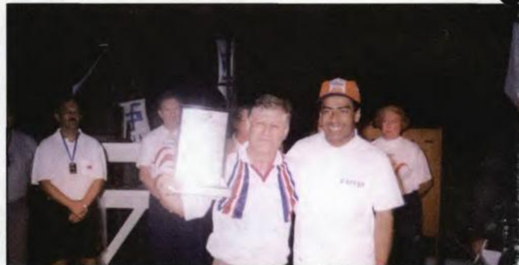
Londrina recebe o troféu de vice-campeão geral por equipe