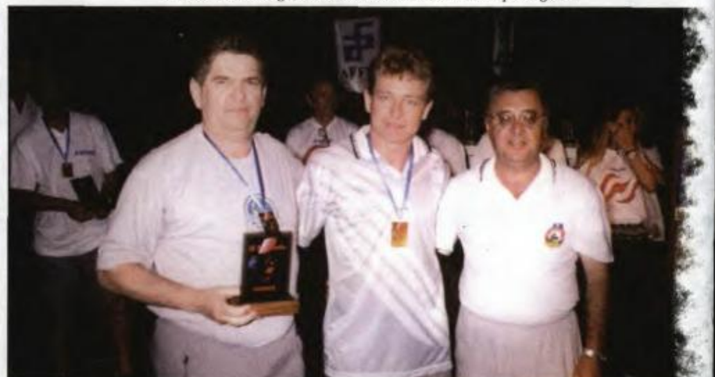
Atletas da 2ª DRR - Região Metropolitana de Curitiba, recebendo o título de 3ª colocada geral