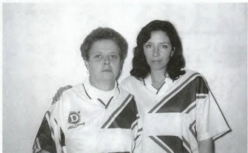
Buraco - Ponta Grossa - Vice-Campeã