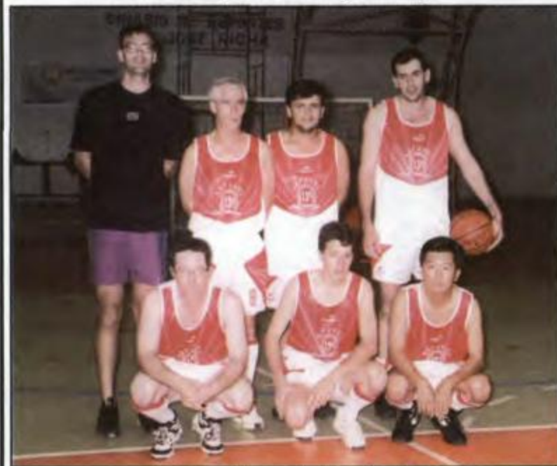
Basquete - Cascavel - Vice-Campeã