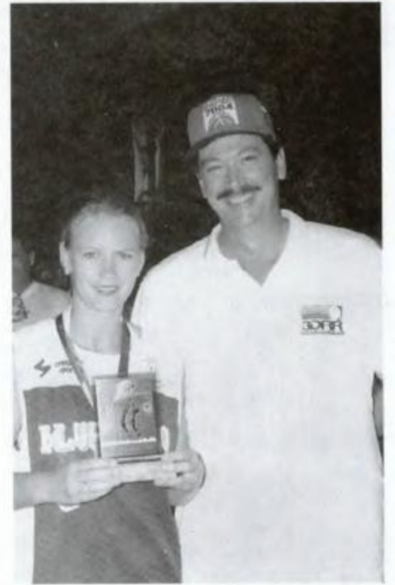
Discurso do encerramento da XV Fiscalíadas pelo presidente da AFFEP e entrega dos troféus