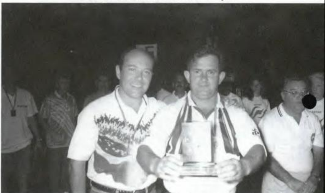
Truco - Londrina - Vice-Campeã