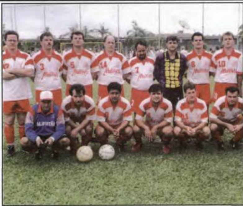
Futebol Suíço Livre - Cascavel - Vice-Campeã