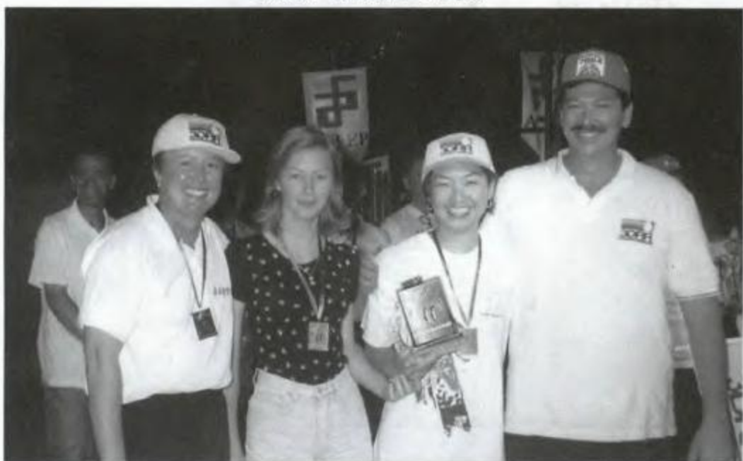
Vôlei de Areia - Ponta Grossa - Campeã