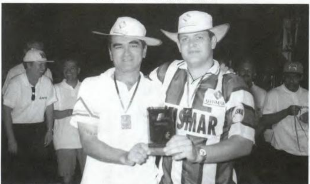
Sinuca - Maringá - Campeã