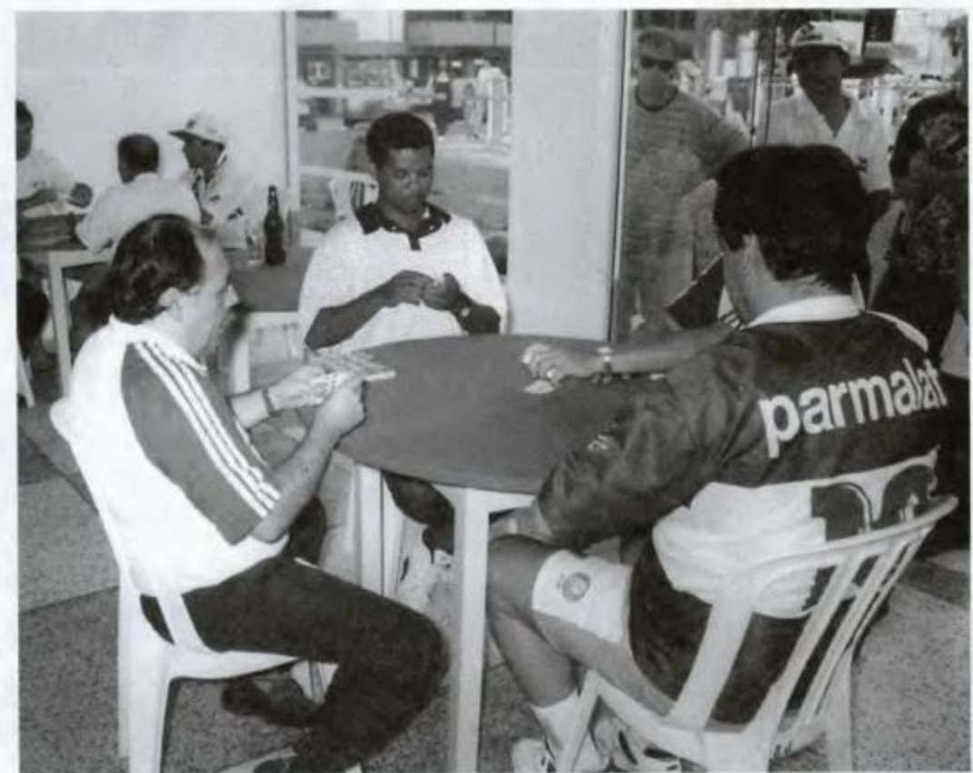
Sala de jogos para cartas