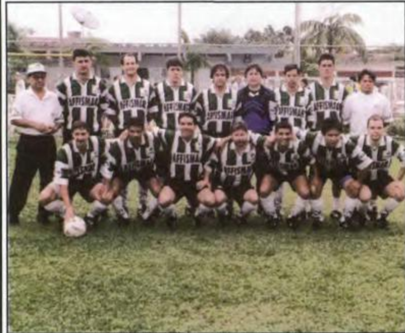
Futebol Suíço Livre - Maringá - 3º lugar