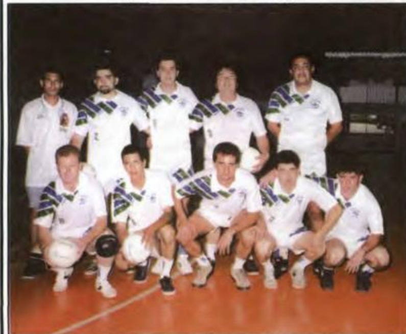
Vôlei - Jacarezinho - Campeã