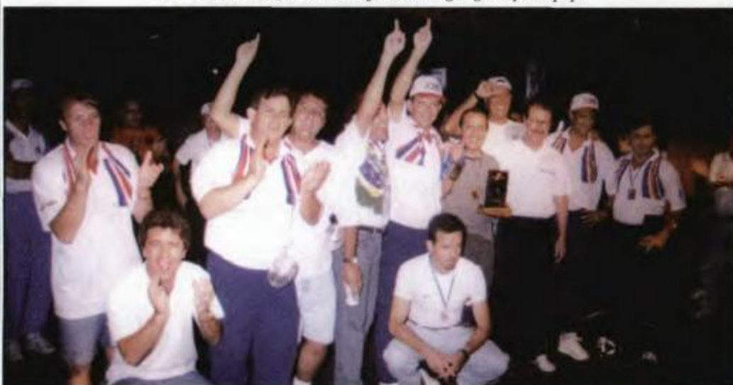
Atletas de Londrina comemorando o título de vice-campeã