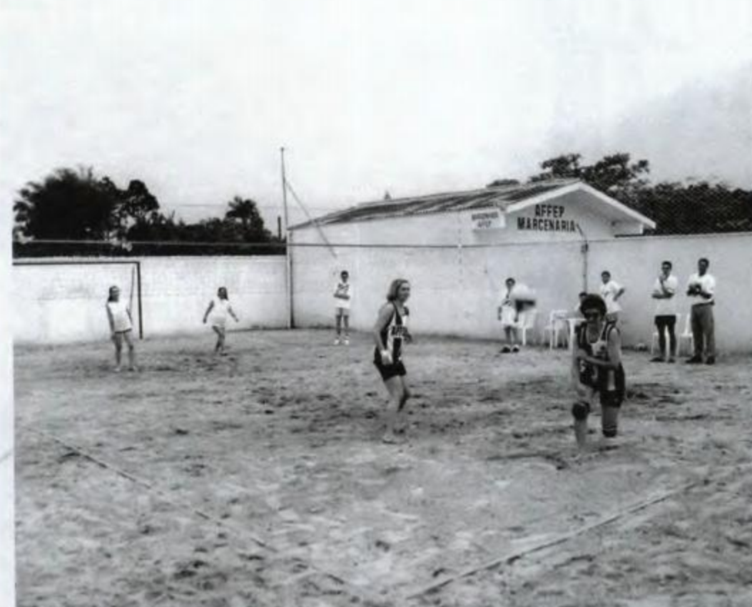
Nova cancha polivalente de areia ao fundo a nova marcenaria

As obras de manutenção são constantes, para que esse patrimônio que é nosso, não se desvalorize, além de oferecer um local aprazível para as férias de verão.