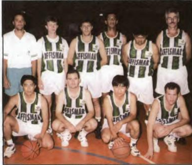
Basquete - Maringá - Campeã