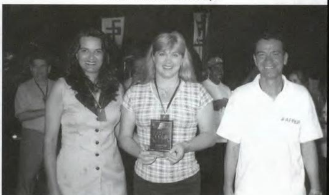
Tranca - Jacarezinho - Campeã