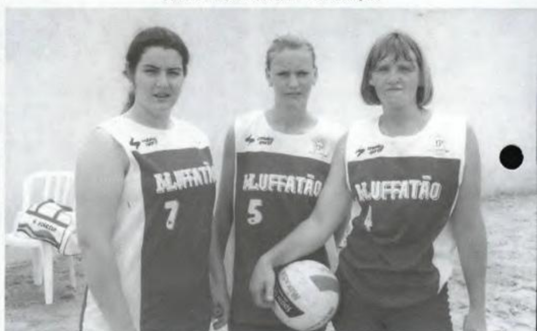
Vôlei de Areia - Cascavel - Vice-Campeã