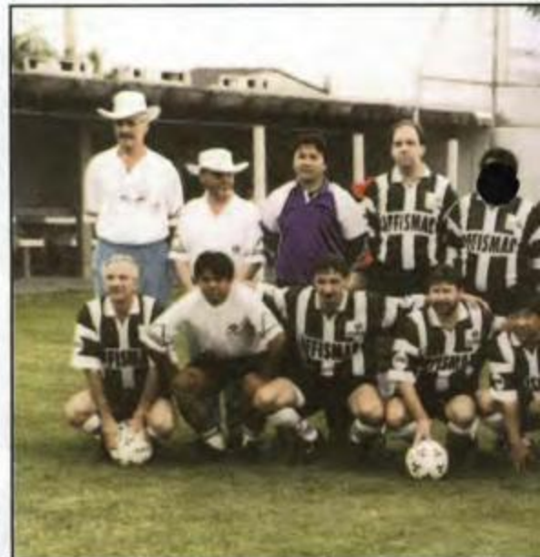
Futebol Suíço Sênior