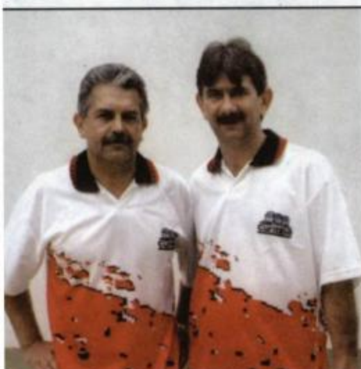
Malha - Curitiba - 1º DRR - Vice-Campeã