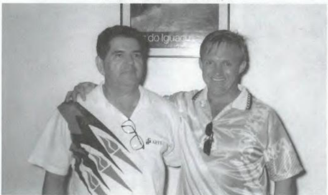
Truco - Curitiba - 2º DRR - Campeã