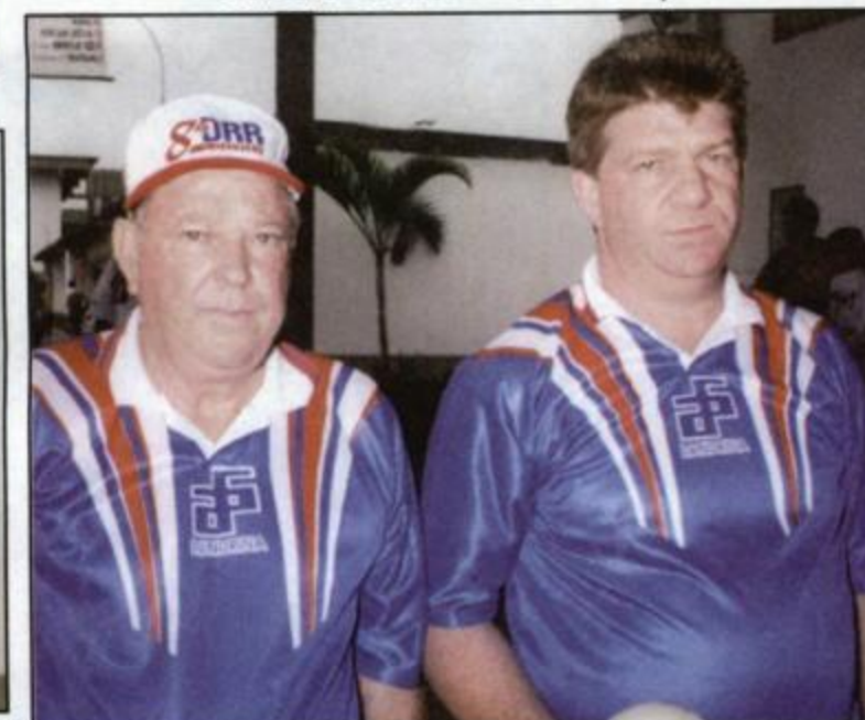
Bocha - Londrina - Campeã