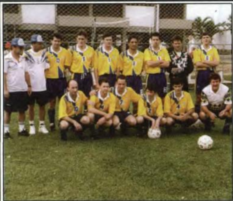
Futebol Suíço Livre - Pato Branco - Campeão