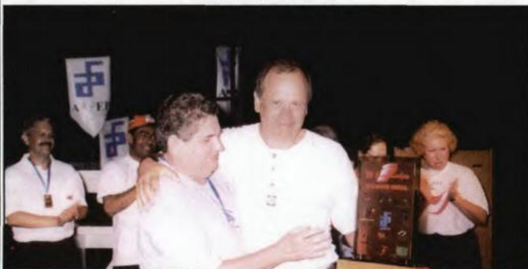
2ª DRR - Curitiba, recebe o troféu de 3º lugar geral por equipe