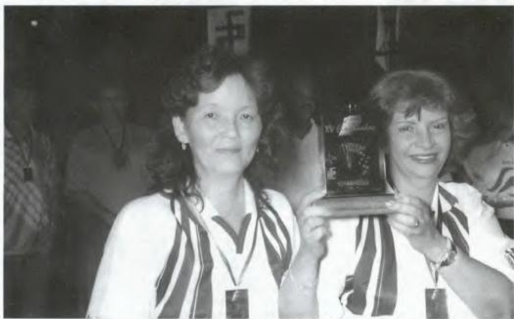
Buraco - Londrina - Campeã