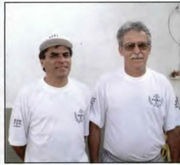
Malha - União da Vitória - Campeão