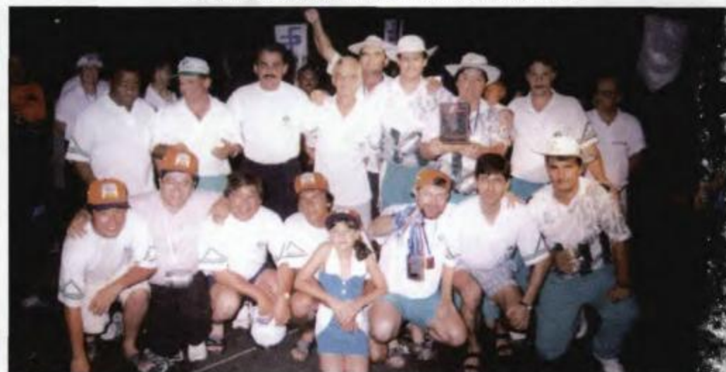
Atletas de Maringá, comemorando o título de campeão geral