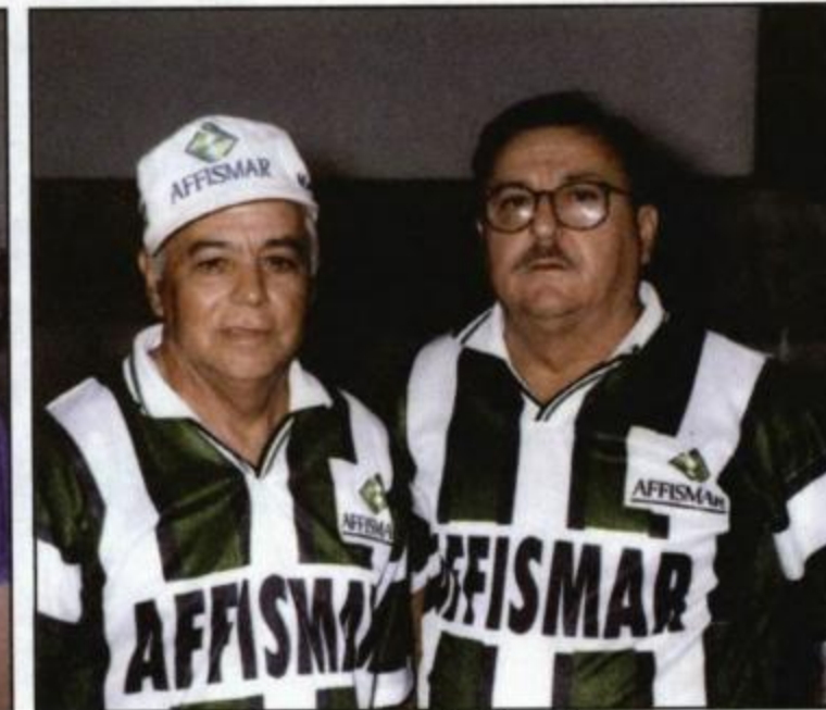
Bocha - Maringá - Vice-Campeã