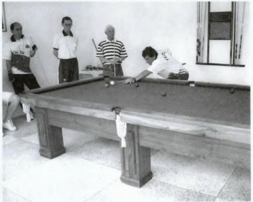
Sala para sinuca

E m 1997, foi adquirido o último terreno, atrás do restaurante, que faltava para fechar uma área total de 1.500 metros quadrados.