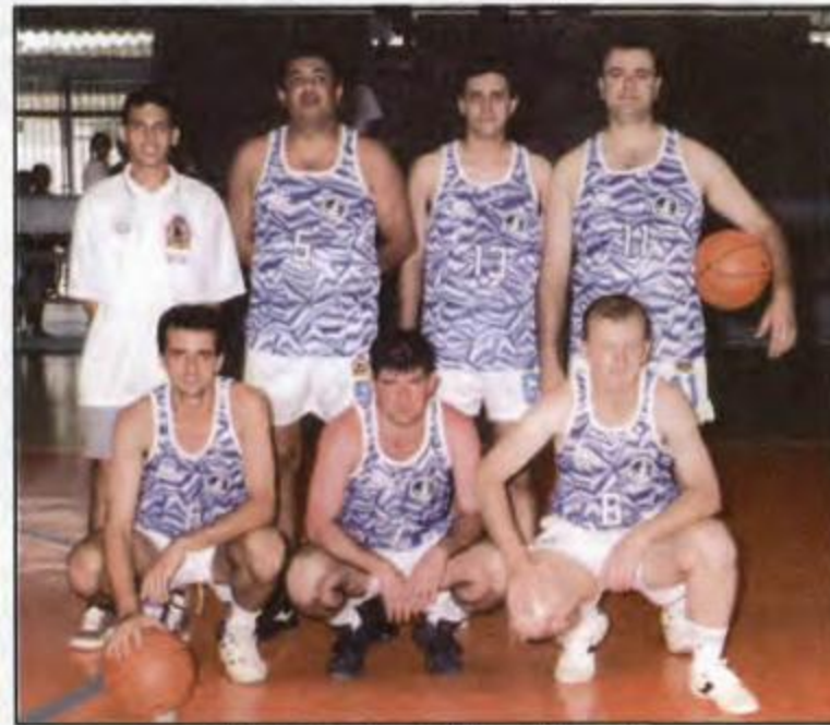
Basquete - Jacarezinho - 3º lugar