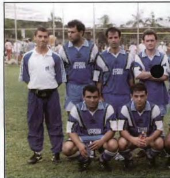
Futebol - Suíço