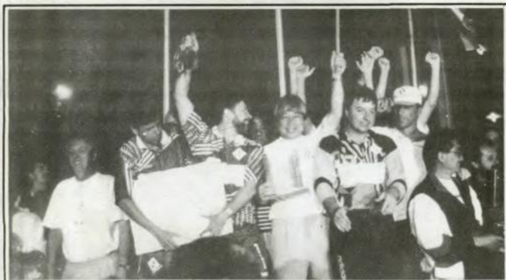
Futebol Suíço Sênior: campeã - Maringá, vice-campeã - Curitiba, 3º lugar - Pato Branco