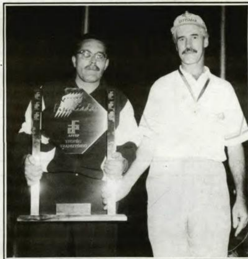
O presidente da AFFISMAR - Maringá passa o troféu de posse transitória ao presidente da AFFEP-Curitiba (1º DRR)