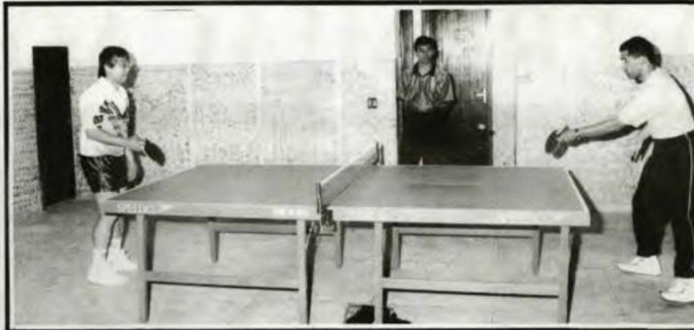
Tênis de Mesa