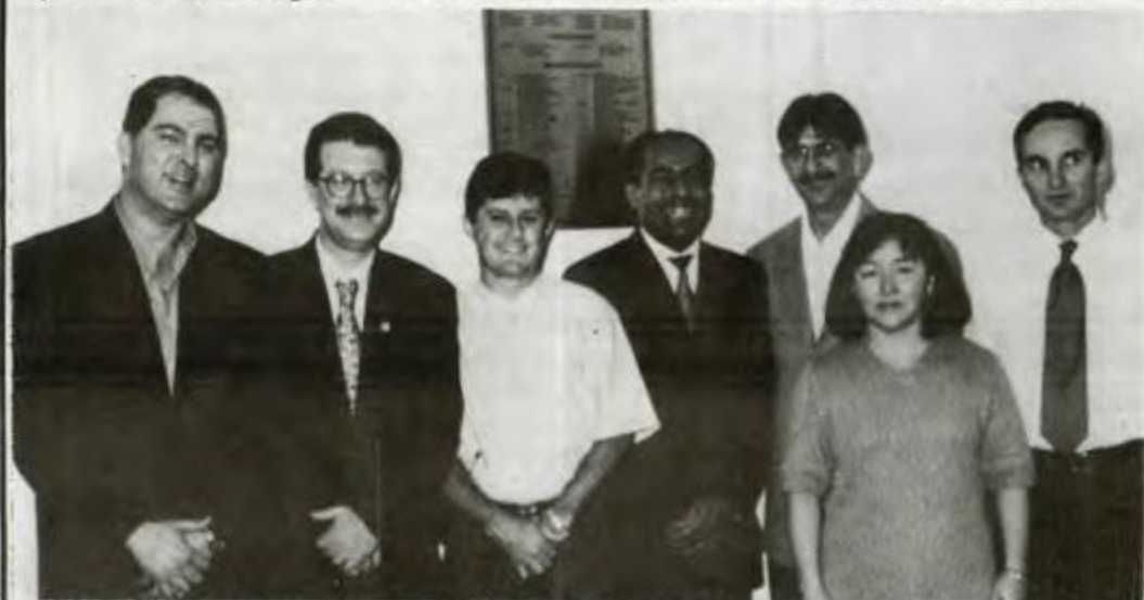
Diretoria do SAFITE na inauguração da sede própria do SAFITE

Fica o convite a todos aqueles que não puderam comparecer à inauguração, para que façam uma visita e venham conhecer esse patrimônio que é de todos.