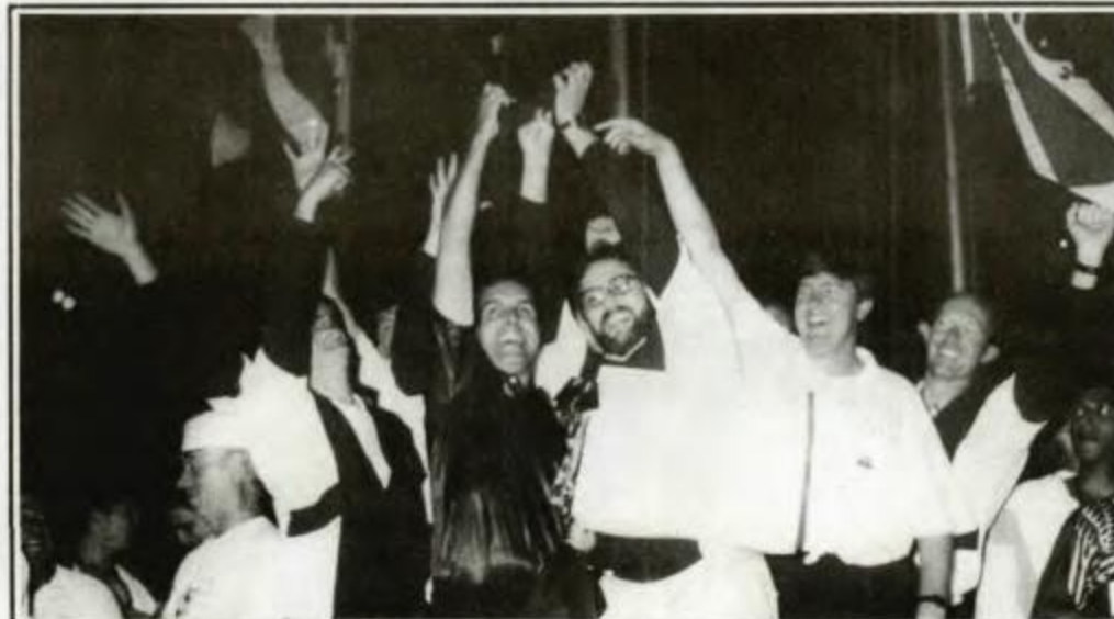
Basquete: campeã - Curitiba, vice-campeã - Maringá, 3º lugar - Cascavel