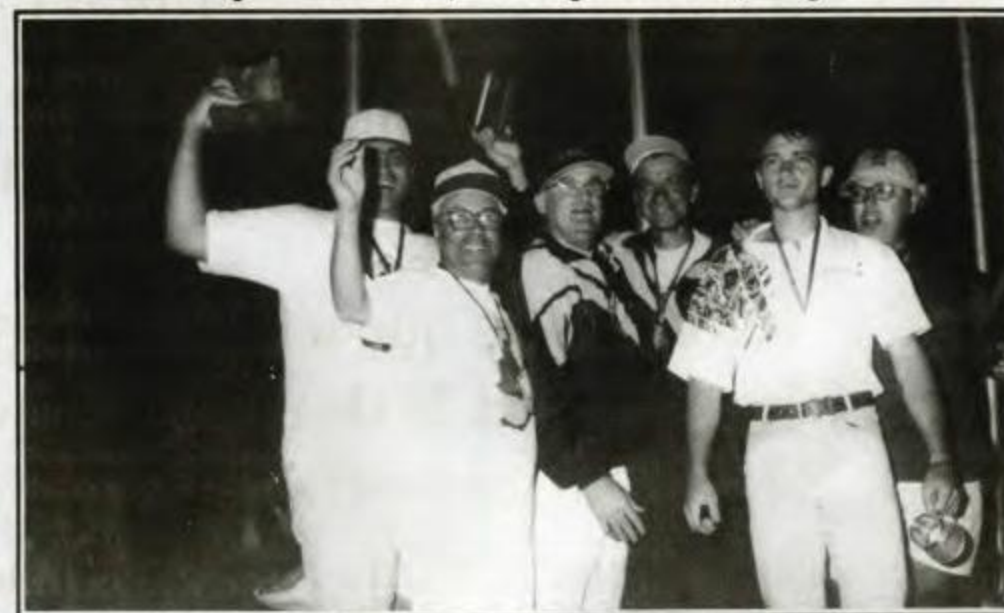
TRUCO - Campeã - CRE, Vice-campeã - Umuarama, 3º lugar - Cascavel