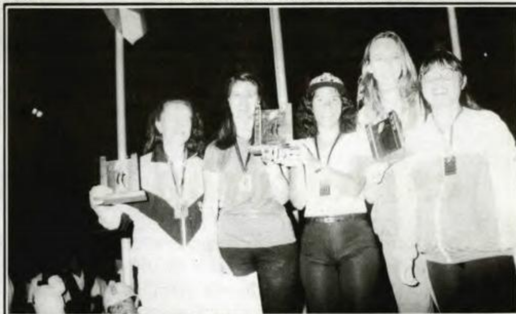
VÔLEI DE AREIA - Campeã - Jacarezinho, Vice-campeã - Umuarama, 3º lugar - União da Vitória