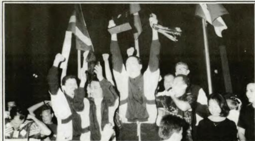
Vôlei: campeã - Curitiba, vice-campeã - Ponta Grossa, 3º lugar - Maringá