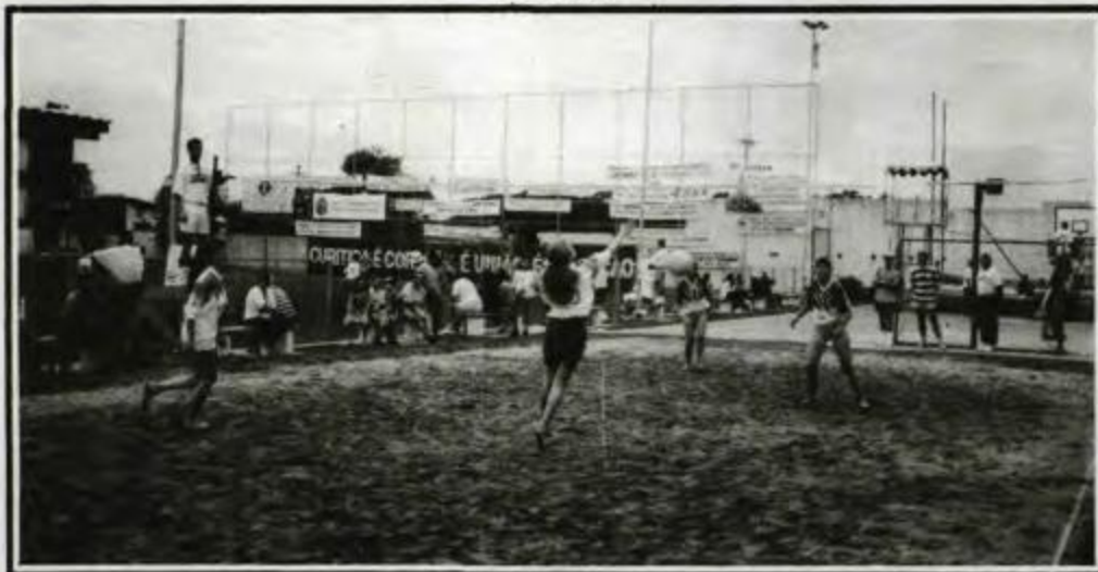
Vôlei de Areia