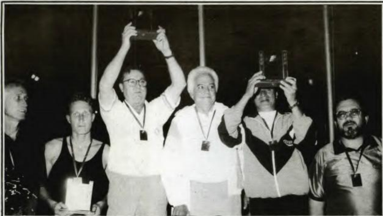
BOCHA - Campeã - Maringá, Vice-campeã - União da Vitória, 3º lugar - Curitiba