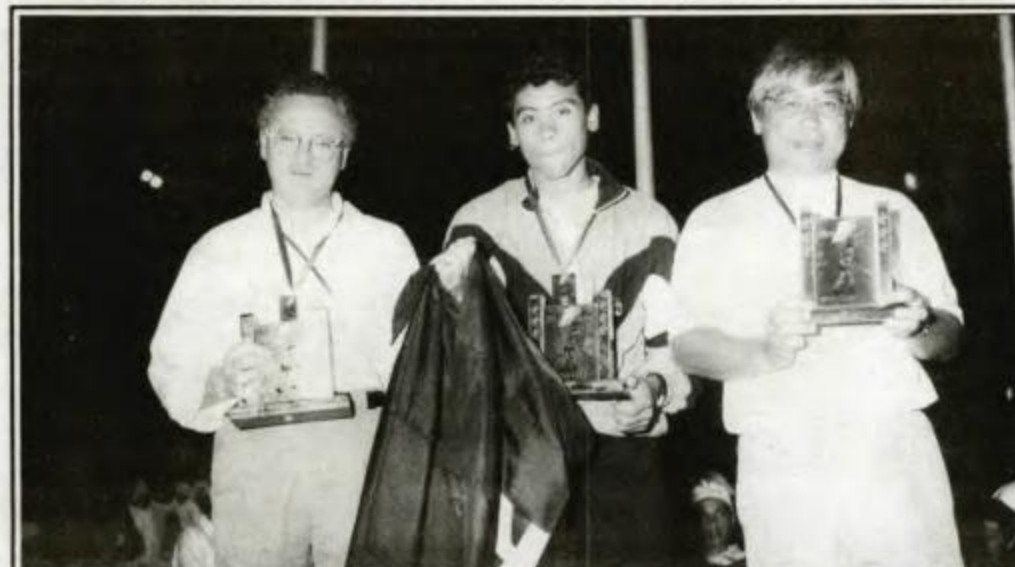
Tênis de Mesa: campeã - União da Vitória, vice-campeã - Maringá, 3º lugar - Curitiba