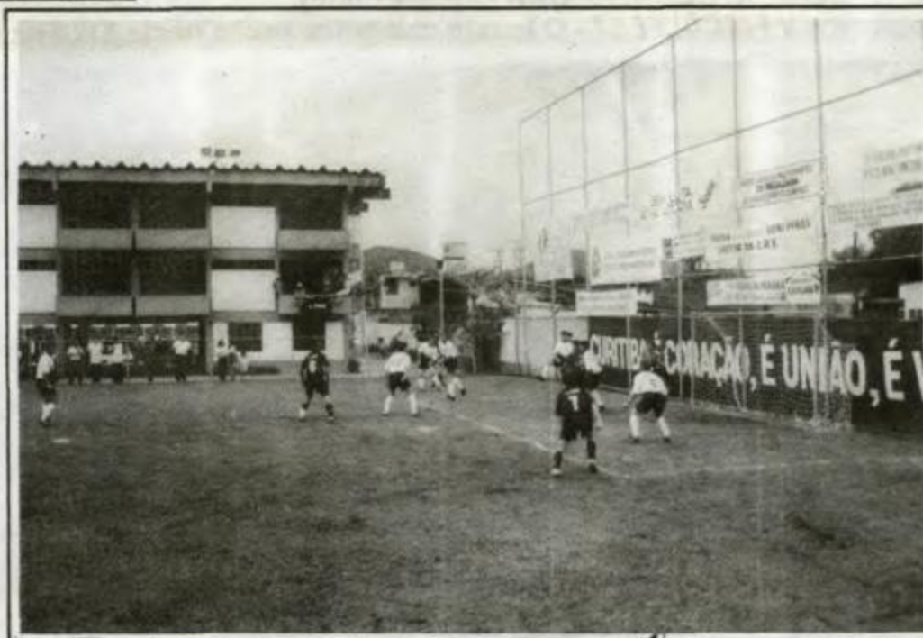
Futebol Suíço Livre