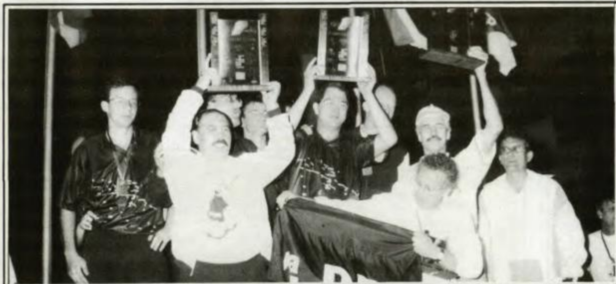
Campeã-geral - Curitiba, vice-campeã geral - Maringá, 3º lugar geral - Cascavel