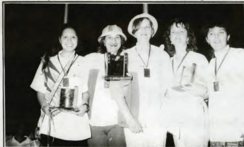
BURACO - Campeã - Umuarama, Vice-campeã - Maringá, 3º lugar - Pato Branco