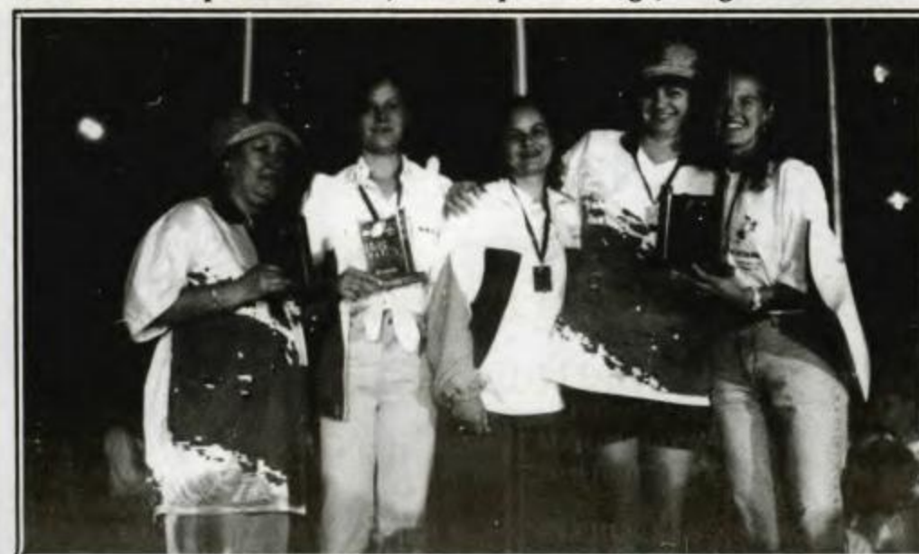
TRANCA - Campeã - Curitiba, Vice-campeã - Pato Branco, 3º lugar - Umuarama