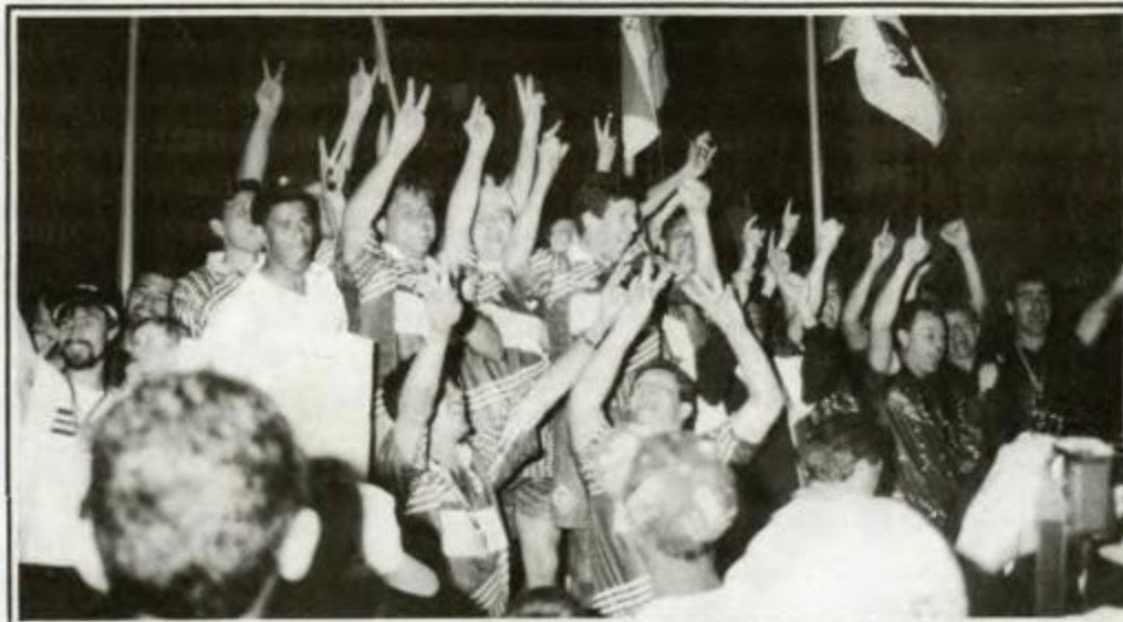
Futebol Suíço Livre: campeã - Maringá, vice-campeã - Curitiba, 3º lugar - Ponta Grossa