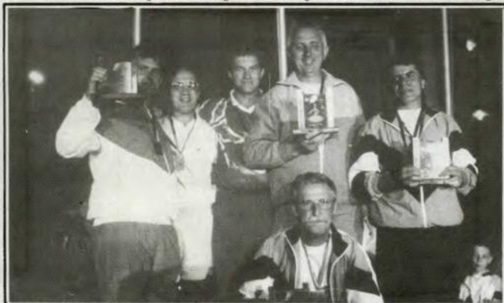
MALHA - Campeã - Cascavel, Vice-campeã - União da Vitória, 3º lugar - Londrina