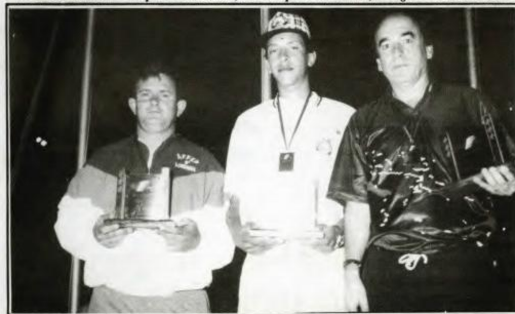
SINUCA - Campeã - Jacarezinho, Vice-campeã - Curitiba, 3º lugar - Londrina