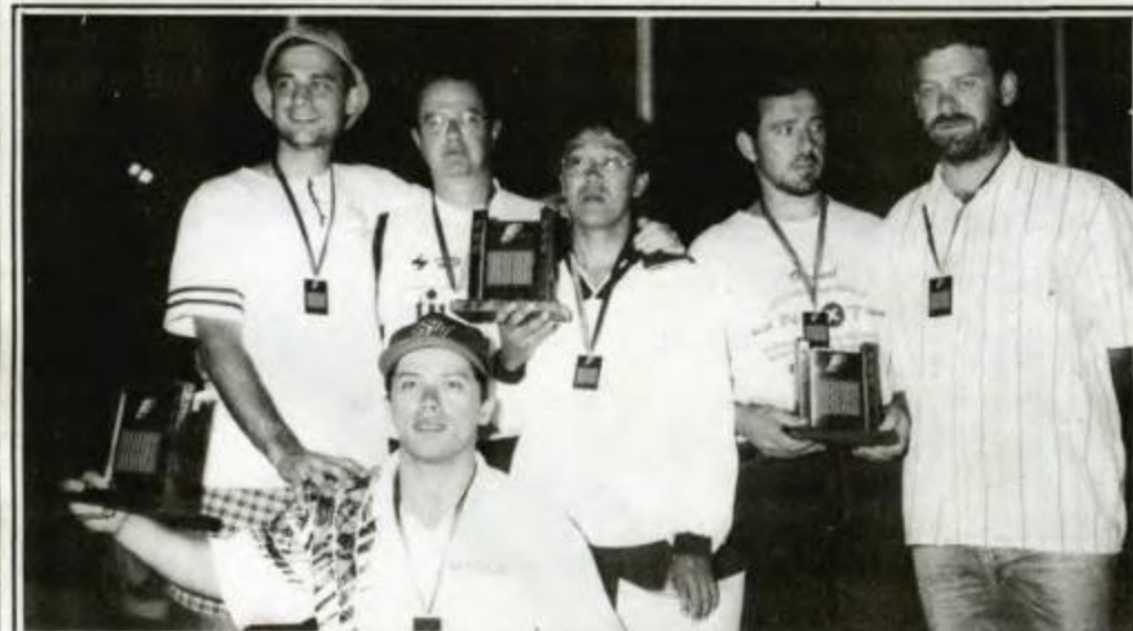
Peabolin: campeã - Cascavel, vice-campeã - União da Vitória, 3º lugar - Curitiba